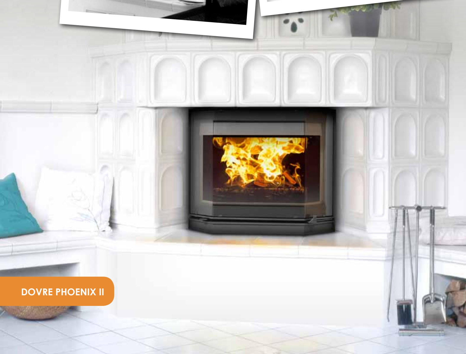
DOVRE PHOENIX II